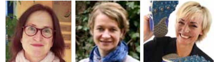
Die Sportlerinnen Silke Ribka, Monika Merl und Heike Drechsler unterstützen die Aktion und laufen mit.

Eine Wettkampfuhr läuft im Start-/Zielbereich zur persönlichen Zeitmessung mit, aber es gibt keine Sieger. Mitmachen ist die Devise! Deswegen gehen die Startnummern nach dem Lauf in eine Tombola ein.